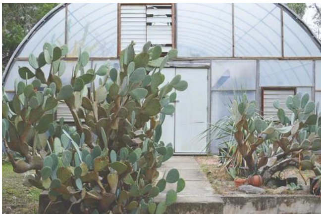
Abri de type Quonset