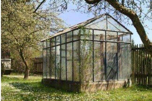
Autonome ou détaché