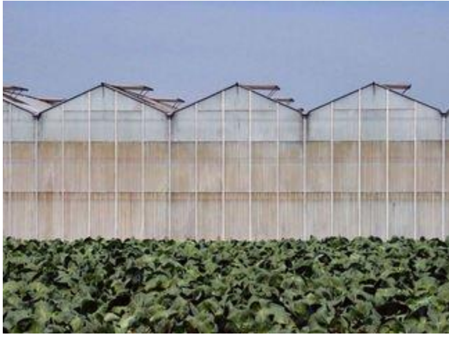
Connecté avec gouttières

(Enseignant) Étude des matériaux et des styles de serres